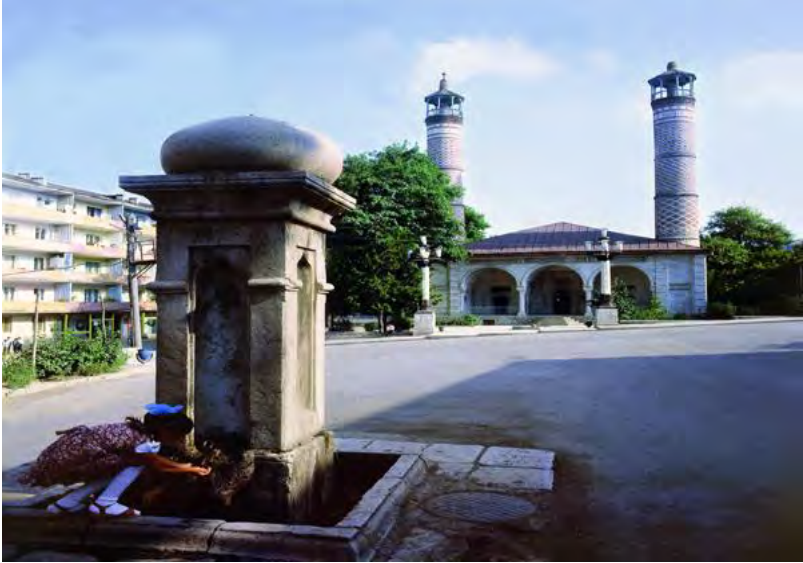
ŞUŞANIN MEYDAN BULAĞI

Eşitdiyimə görə hay ünsürləri bulağın daşın Azərbaycan şəhəri olan İRƏVANA aparıblar