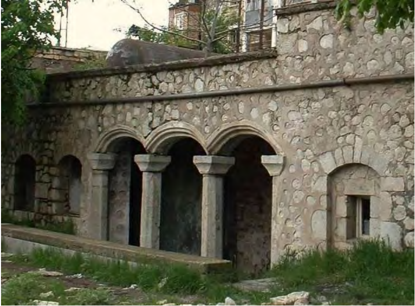
ŞİRİN SU HAMAMI