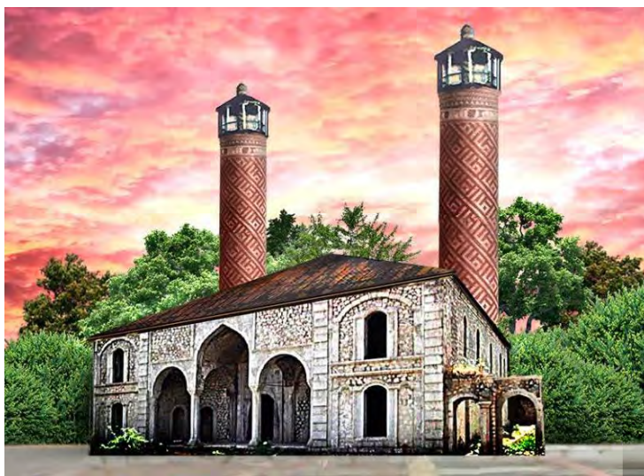
AŞAĞI CÜMƏ MƏSCIDI