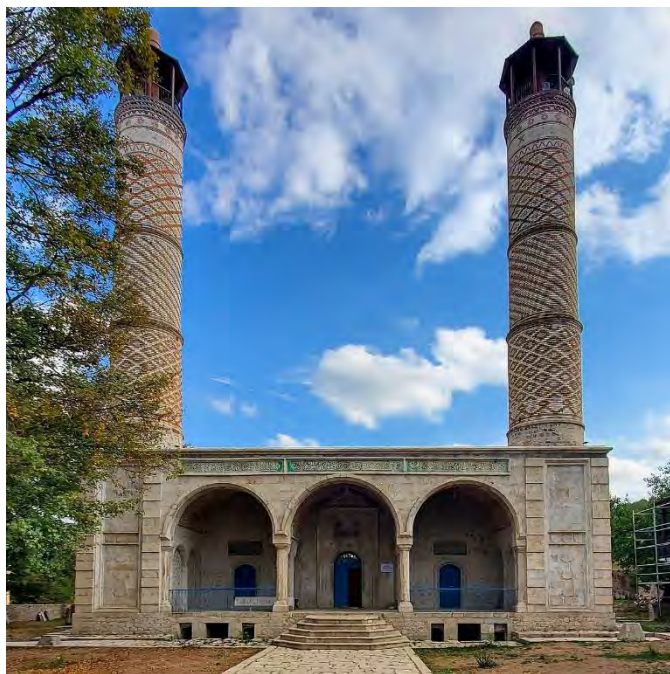
YUXARI CÜMƏ MƏSCIDI