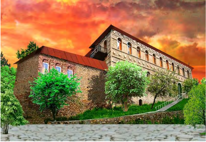
XURŞUDBANU NATƏVANIN EVI