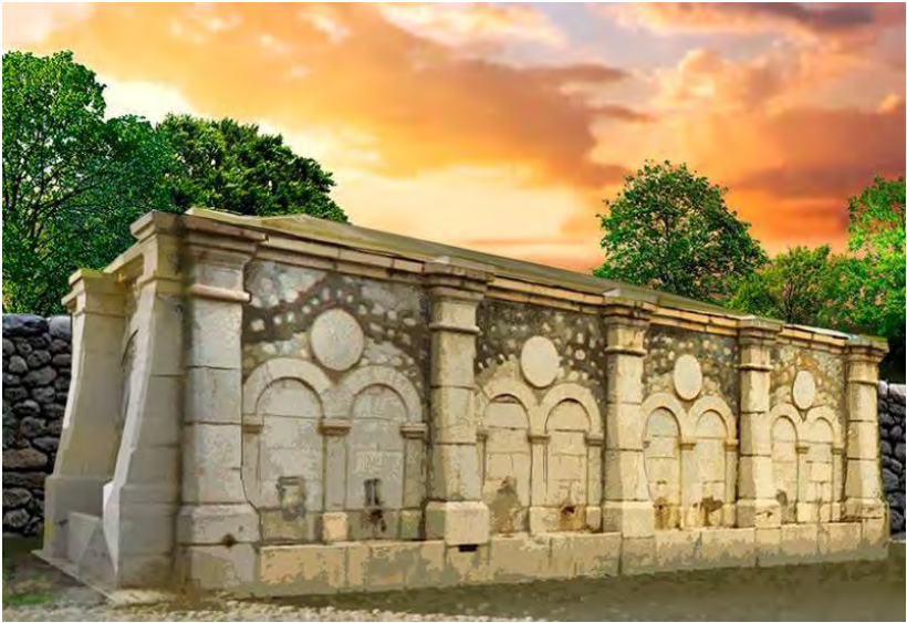
XAN QIZI BULAĞI